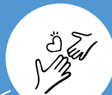
Lutte contre l'isolement