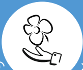
Santé et environnement